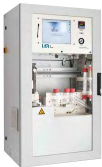
QuickTOCultra 复杂废水应用的 水分析仪