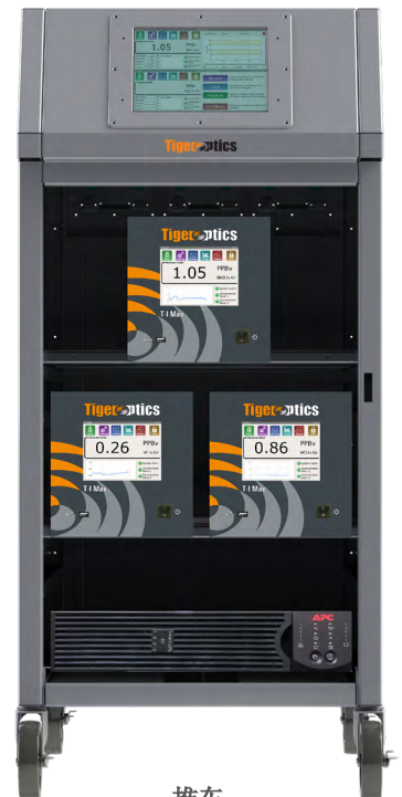
推车 监控AMC的移动式 解决方案