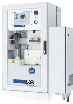
QuickTOCpurity 纯水和工艺过程应用的 水质分析仪