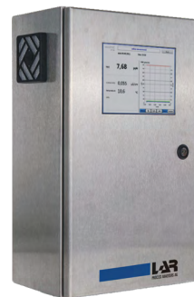
QuickTOCtrace 超纯水应用的 水分析仪