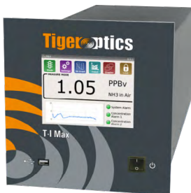
T-I Max HCl