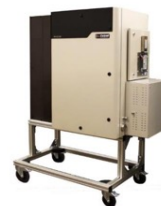
MAX300-RTG 用于过程控制的多通路质谱仪