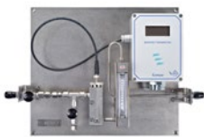
XDT系列 可配置定制化的集成系统