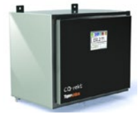
CO-rekt 实时分析H 2 O, CO, CH 4 和CO 2 杂质的气体分析仪