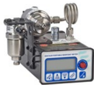
HDT / XPDM / LPDT系列 便携式、固定式、回路供电的氧化铝露点仪