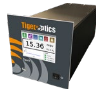
CRDS技术分析H 2 O, CH 4 , CO, CO 2 , 和C 2 H 2 等微量杂质