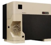
MAX300-LG 实时分析ppb级别各种杂质的质谱仪